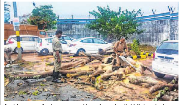
A quick response disaster management team clears a tree that fell storm due to cyclone Mocha storm at Veer Savarkar International Airport in Port Blair

AGENCIES / Port Blair A cyclonic circulation in the Bay of Bengal intensified into a deep depression near Port Blair in Anadaman and Nicobar Islands and will likely turn into a full heave account for the MD acid blown cyclone, the IMD said. The India Meteorological Depart-ment (IMD), which closely monitors the cyclonic storm, said it is likely to make landfall between Cox's Bazar in Bangladesh and Kyaukpyu in Myanmar on Sunday. A statement issued by GK Das,